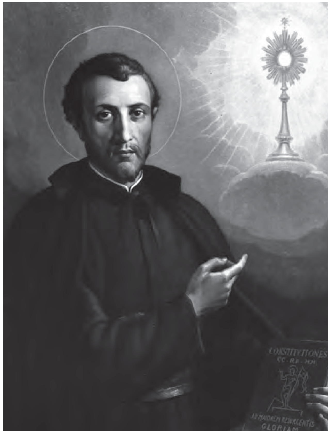
Sveti Franjo Caracciolo ustanovio je pobožnu praksu trajnog klanjanja Presvetom Sakramentu.

Dana 7. lipnja 1608. godine bio je vrlo hladan dan u Agnoneu, gradiću u regiji Molise u kojem je Franjo Caracciolo, osnivač karačolina, izdahnuo od kratke i iznenadne bolesti tri dana prije toga. Franjo je imao samo 44 godine, ali mu je tijelo bilo uvelike izmučeno nedaćama života provedena u intenzivnom pastoralnom djelovanju i dugim noćima provedenima u molitvi ničice na podu, u klanjanju pred Presvetim Sakramentom. Franjo je izdahnuo 4. lipnja, a tri dana nakon toga „kirurg“ je izvadio utrobu i srce prije nego što su subraća odnijela njegovo tijelo u Napulj.