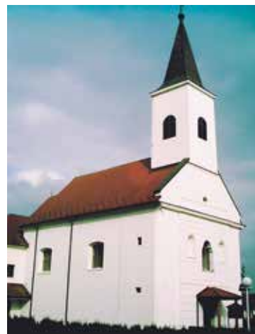
Obnovljena župna crkva u Lupoglavu