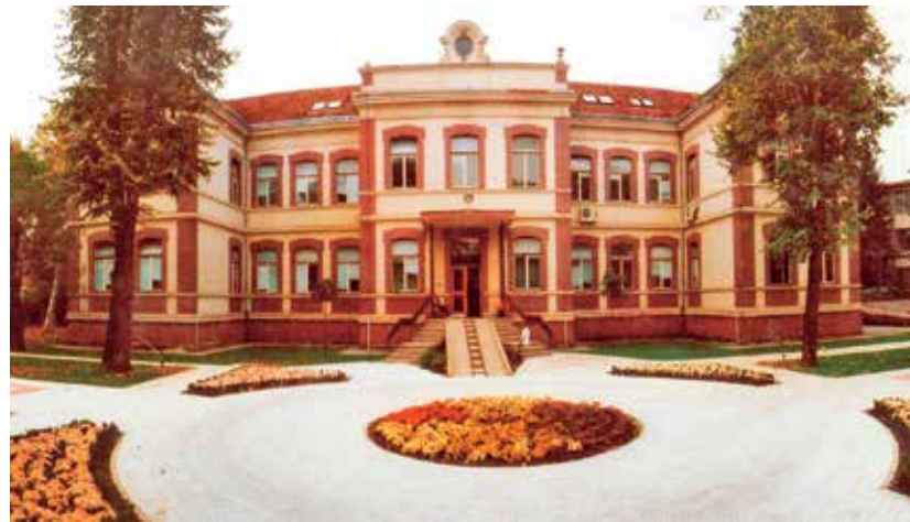
Bolnica u Sl. Brodu u kojoj je p. Rupert posjećivao tisuće bolesnika i donosio im duhovnu utjehu i pomoć tijekom godina svoga boravka u tome gradu

Ova kapelica u slavonskobrodskoj bolnici s vremenom je lijepo uređena i proširena te je u njoj postavljena velika slika p. Ruperta u spomen na njegov pionirski bolnički apostolat kojim je pripremio teren za njezino osnivanje i otvorenje kao prve bolničke kapelice u slobodnoj i neovisnoj hrvatskoj državi.