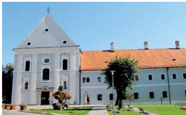
Franjevačka crkva i samostan u Slav. Brodu