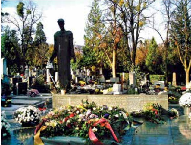
Franjevačka grobnica na Mirogoju u Zagrebu u kojoj p. Rupert očekuje uskrsnuće

Na kraju ovoga kratkog životopisa p. Ruperta, evo i nekoliko izrazitijih zaključnih izjava i svjedočanstava osoba koje su ga poznavale, s njime surađivale ili su bile primatelji njegove pastoralne skrbi i duhovnih dobročinstava. Svatko ga je na svoj način doživio u njegovu svetačkom življenju i djelovanju te istaknuo po jednu dvije vrline njegova duhovnog lika. Kao prvo, donosimo svjedočanstvo mons. Stjepana Belobrajdića, slavonskobrodske dekana, dijecezanskog svećenika čije riječi imaju posebno značenje jer nam otkrivaju kako su p. Ruperta doživljavali članovi biskupijskog klera.