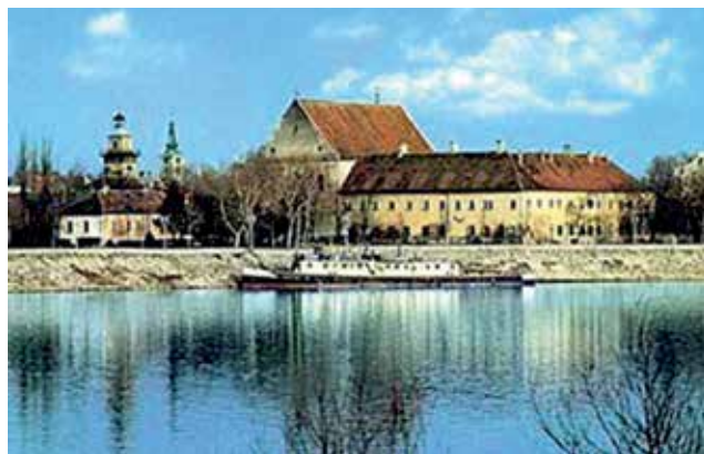
Franjevački samostan i crkva u Slavenskom Brodu