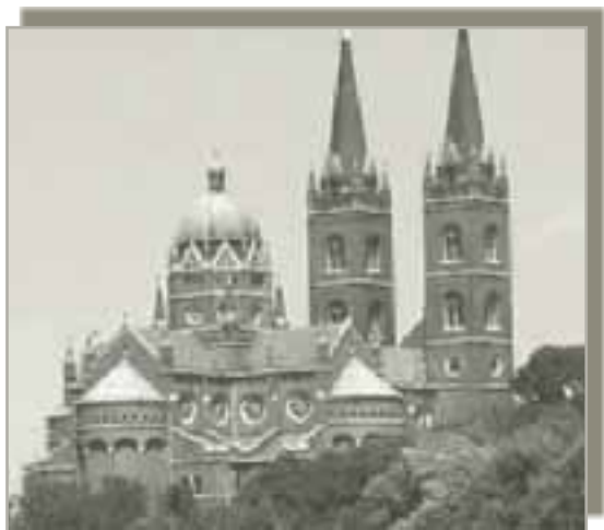
Katedrala u Đakovu