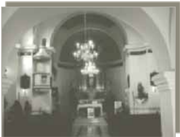
Unutrašnjost obnovljene crkve u Lupoglavu danas

mu dolazi na ispovijed pa je znao staviti zavjesu u ispovjedaonicama gdje nije bilo rešetaka. Veoma je štovao patra Pija iz Italije i s njime je bio u kontaktu putem pisama. Za propovijedi se savjesno pripremao. Sjećam se njegovih skica za propovijedi koje je imao pred sobom i nikada nije zastao, niti je bio u nedoumici što reći. Stvarno je bio uzor svetog čovjeka.