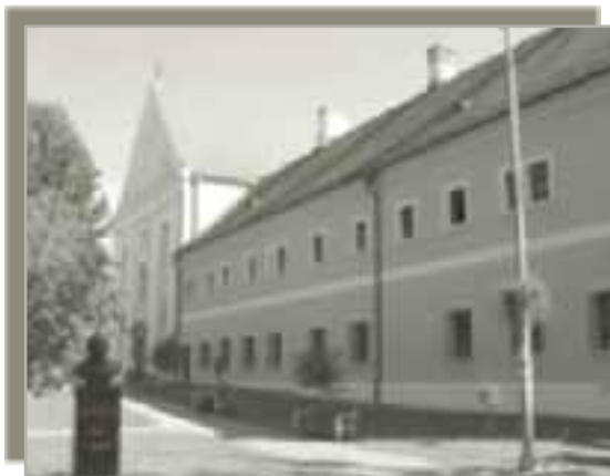
Franjevački samostan s crkvom u Slavanskom Brodu