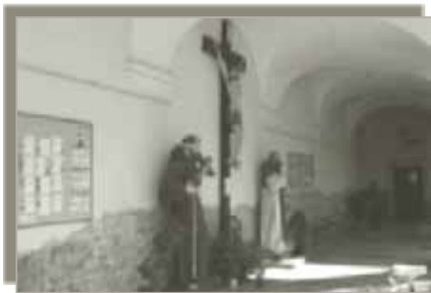
Unutrašnjost Franjevačkog samostana u Slavonskom Brodu