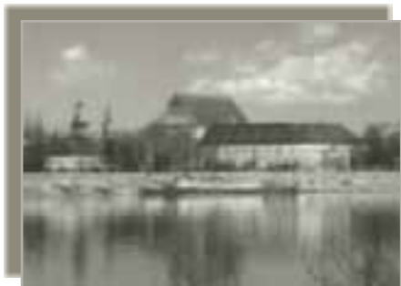
Franjevački samostan u Slavenskom Brodu – pogled s druge strane Save