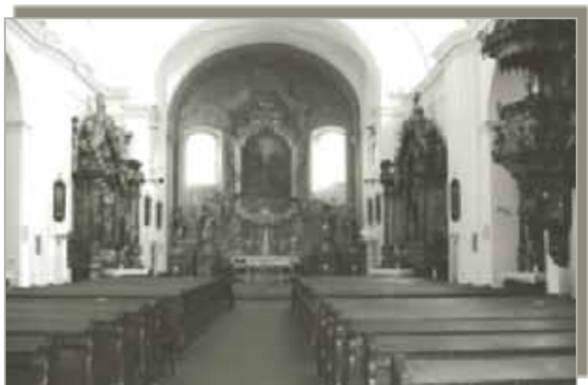
Unutrašnjost franjevačke crkve u Slavonskom Brodu gdje je p. Rupert provodio mnoge sate u molitvi

Skupina nadobudnih mladića često je dolazila noću u park pred Franjevački samostan u Slavonskom Brodu gdje su ga-