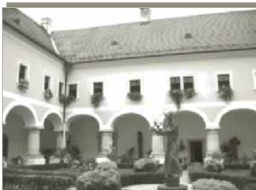
Dvorište franjevačkog samostana u Slavonskom Brodu