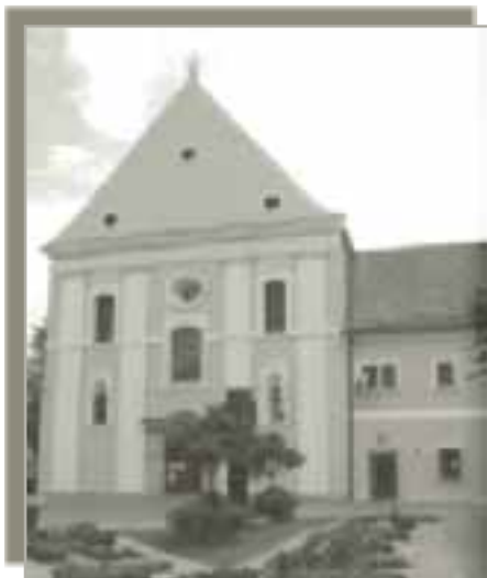
Pročelje franjevačke crkve u Slavonskom Brodu

malo se poigrao s djecom, a onda je započeo pjevati svete pjesme i slaviti Boga. Ja sam ostala iznenađena i sva u čudu nad prizorom. A on mi, objašnjavajući svoj postupak i pjevanje, reče da u kući gdje ima ovako puno male djece stanuje Isus, a on sluga njegov želi svoga Gospodina pozdraviti. Kad je odlazio sve nas je blagoslovio, a ja sam ostala sva u suzama, puna radosti jer sam dobila potvrdu da sam na dobrom