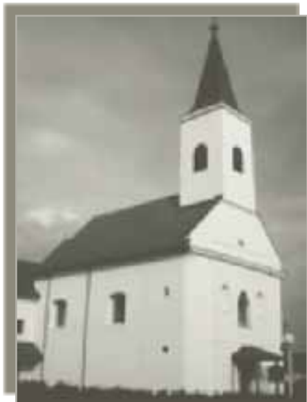
Obnovljena župna crkva u Lupoglavu danas gdje je p. Rupert u odsutnosti župnika obavljao pastoralnu službu kroz deset godina