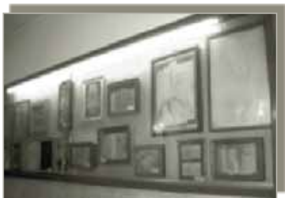
Predmeti u vitrini povezani sa znakovima čistilišta u muzeju u Rimu. (Fotografija iz 2008.)

ruke, otisci cijeloga dlana i drugo. Sve je to bilo u knjizi bogato ilustrirano fotografijama koje nam je pater Rupert pokazivao i živo tumačio. Na nas vjeroučenike ostavilo je to dubok dojam. Svi sakupljeni predmeti izloženi su u posebnom muzeju koji je u tu svrhu ustanovljen u Rimu, a nalazi se još i danas u sklopu male neogotičke crkvice Srca Isusova na obali Tibera, između hrvatske crkve sv. Jeronima i ulice Conciliazione koja vodi prema Vatikanu. Kada sam kasnije kao student došao u Rim, potražio sam taj muzej. Posjetio sam ga i stvarno je sve ondje bilo onako kako nam je pater Rupert tako dojmljivo prikazao i tumačio. Taj je muzej odmah na početku, prigodom njegova otvaranja koncem 19. stoljeća, posjetio i sam Papa Leon XIII. Muzej i danas postoji i moguće ga je posjetiti.