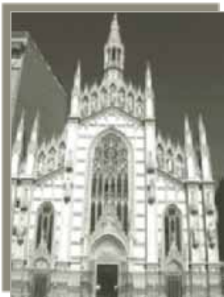
Crkva Srca Isusova na obali Tibera u Rimu u kojoj je smješten muzej znakova iz čistiliša

I svojim vjeroučenicima pater Rupert je nastojao što više približiti nadnaravni svijet i u onim ozbiljnim dimenzijama.