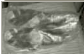
Sandale p. Ruperta, jedini njegov sačuvani odjevni predmet. Sačuvala ih je kao relikviju obitelj Zečević u Slavanskom Brodu

Članovi FSR su za ovu prigodu pripremili zajedničku večeru uz prijateljsko druženje u samostanskim prostorijama. Ovaj je simpozij otkrio da Crkva u Hrvata ima još nepoznatih duhovnih velikana koje treba otkriti i upoznati, a njihov život i djelo postaviti na svijetnjak da svijetle svima. Za 15. obljetnicu smrti p. Ruperta njegovi prijatelji izdali su i spomen-sličice s njegovim likom na poleđini kojih je tiskana njegova kratka biografija.