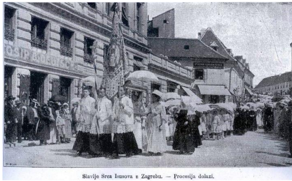
Slavlje Srca Isusova u Zagrebu. — Procesija dolazi.

Na tisuće i tisuće mladih Hrvata u svim hrvatskim biskupijama ponovno je posvjedočilo svoju vjeru i odanost Isusu Kristu. Najsvečanije je bilo u Zagrebu. Za obnovu Posvete bila je pripremljena svečana Zastava koju je ručnim radom kroz dva mjeseca izrađivalo 20 časnih sestara milosrdnica i koja je sve do danas ostala sačuvana kao duhovni i materijalni spomen na samu Posvetu.